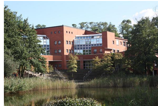
Konrad-Adenauer-Schule in Kriftel